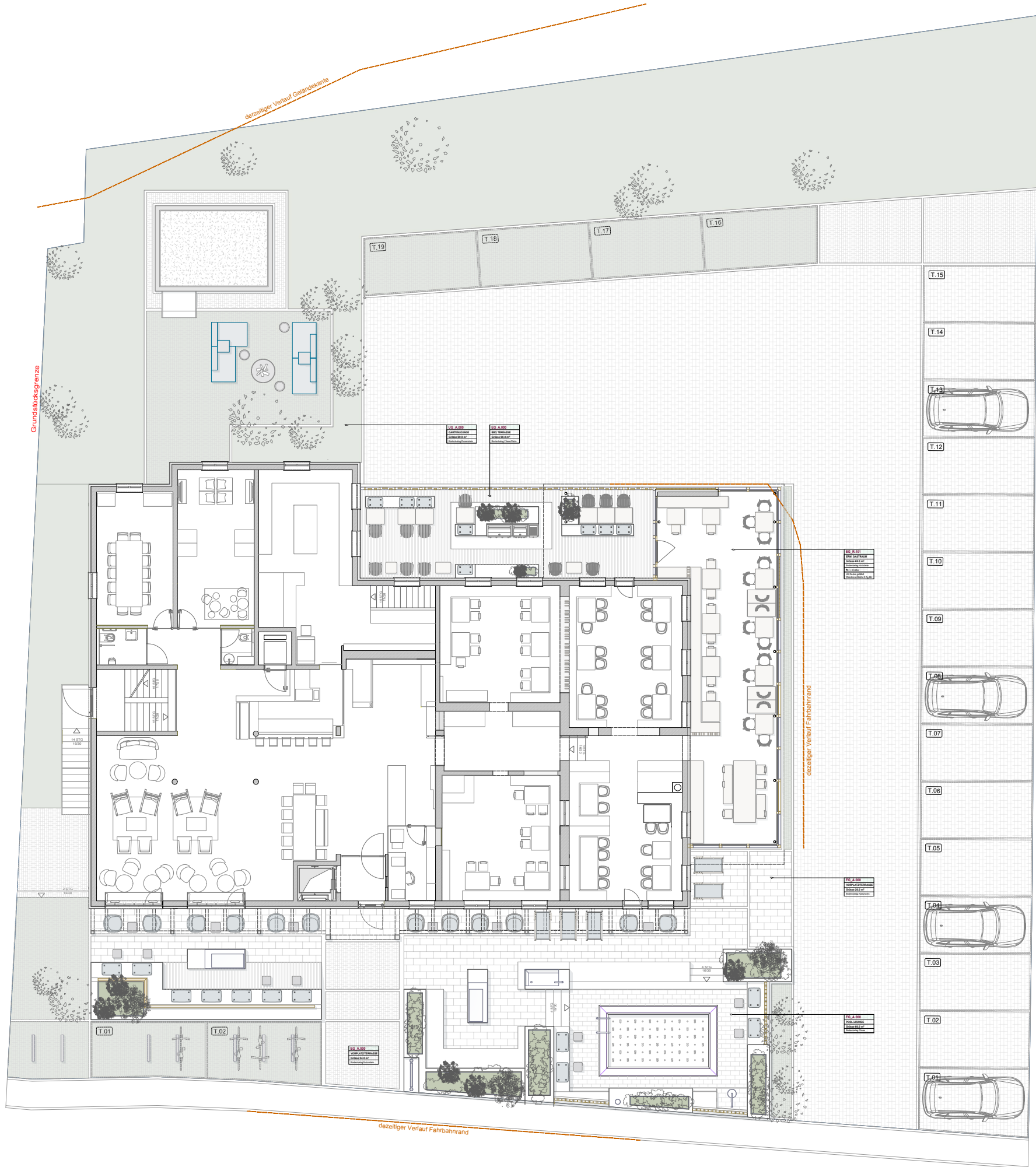
GRUNDRISS ERDGESCHOSS (Variante A)