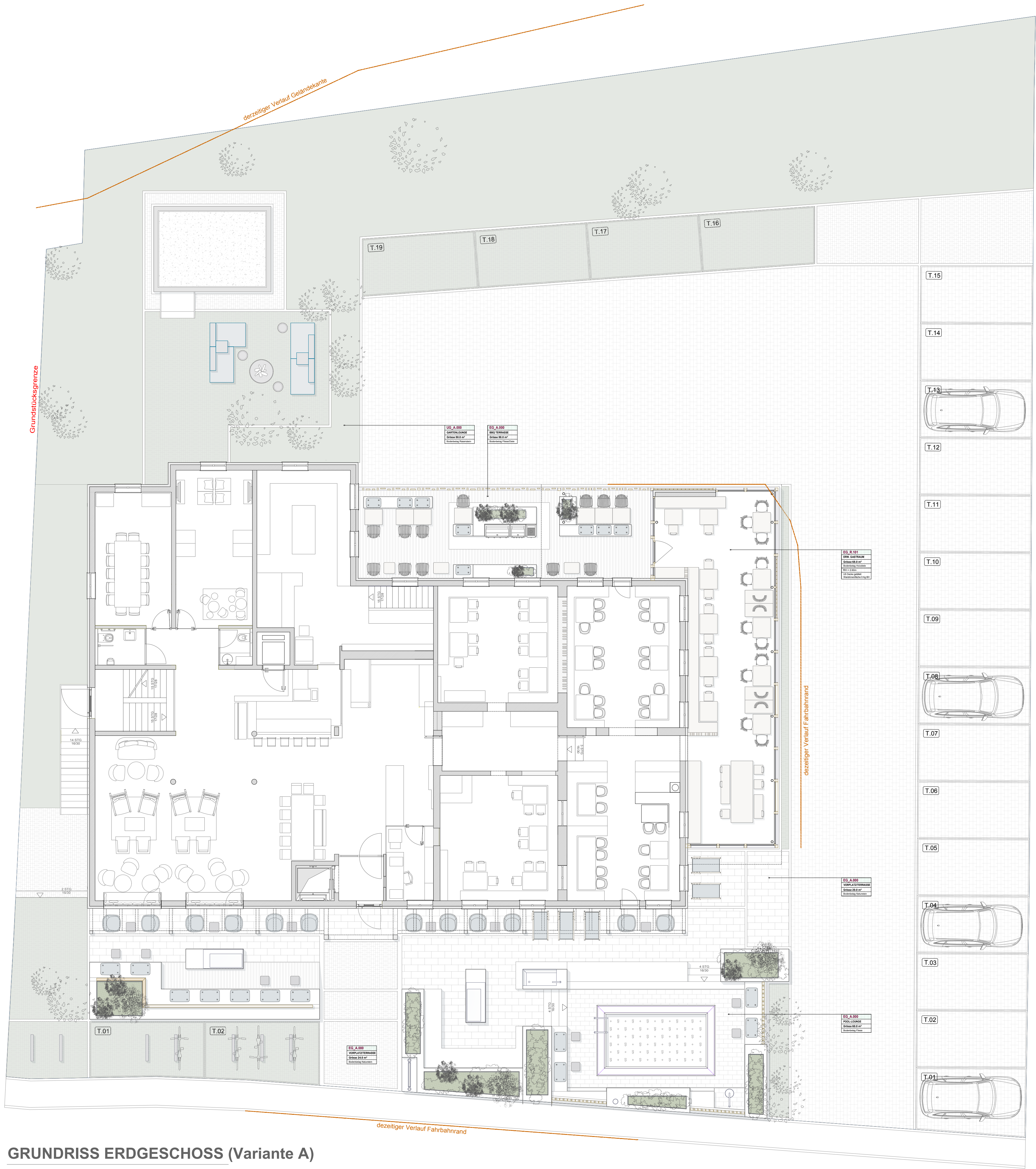
GRUNDRISS ERDGESCHOSS (Variante A)